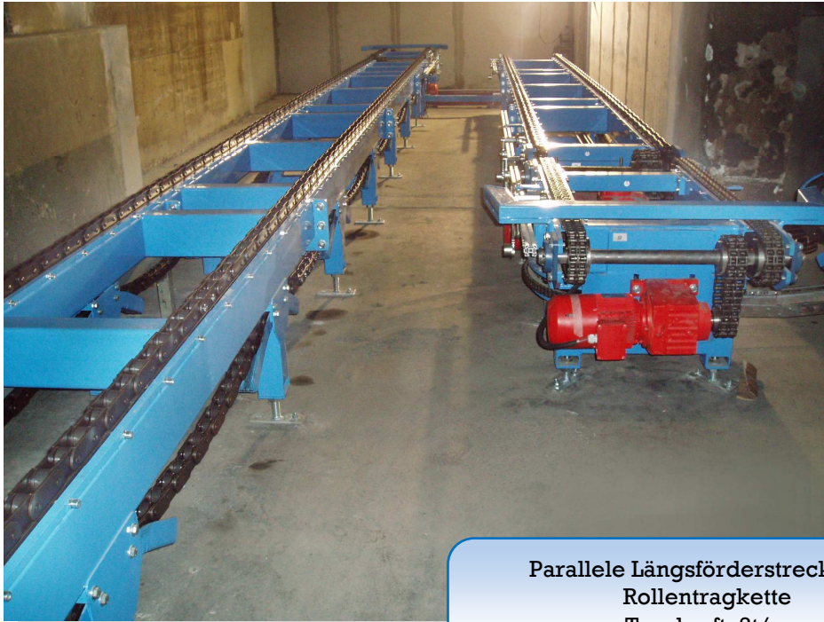
Parallele Längsförderstrecke mit Rollentragkette Tragkraft: 2t/m