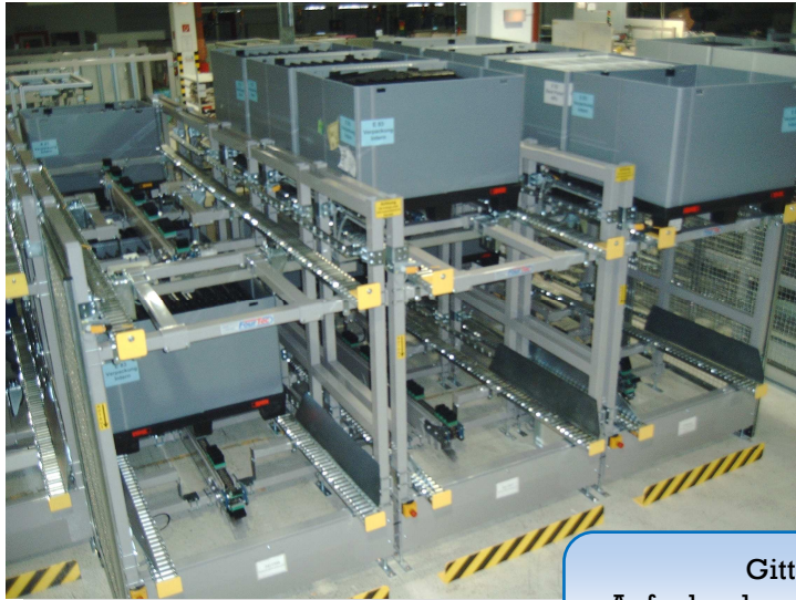
Gitterbox – Förderer Aufgabe der vollen Gitterboxen quer mit dem Stapler.