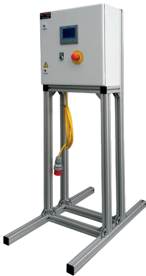
Grundgestell für Schaltkasten