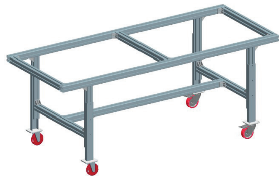
Grundgestell für Holztischplatte

Übermitteln Sie uns Ihre Projekte, Skizzen oder Ihren Bedarf! Wir planen, konstruieren, fertigen und montieren ganz nach Ihren Wünschen.